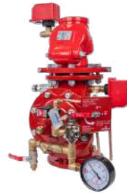
77PA EL MR Elektrik Aktivasyonlu