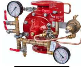
77DE PN MR Manual Reset