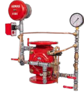
67DE EL AL Full Trim Set