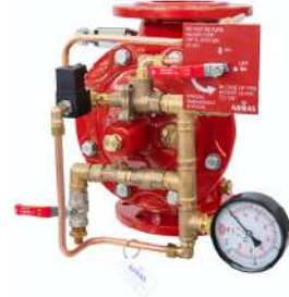
77DE EL RR Remote Reset

*Fiyatlar USD'dir ve KDV dahil değildir.