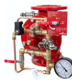
77DE EL MR Manuel Reset