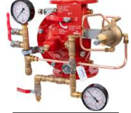
77DE PN RR Remote Reset

*Ex proof korumalı solenoid için fiyat sorunuz.